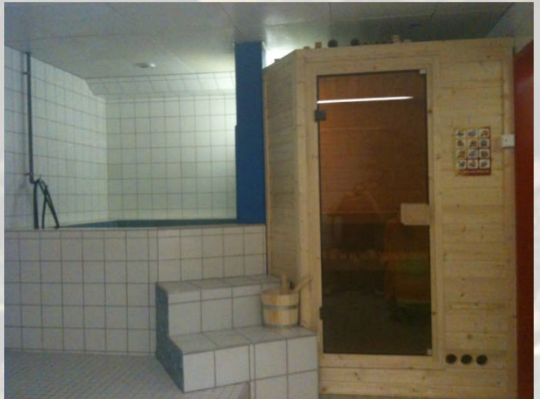
Sauna mit Kaltwasserbecken