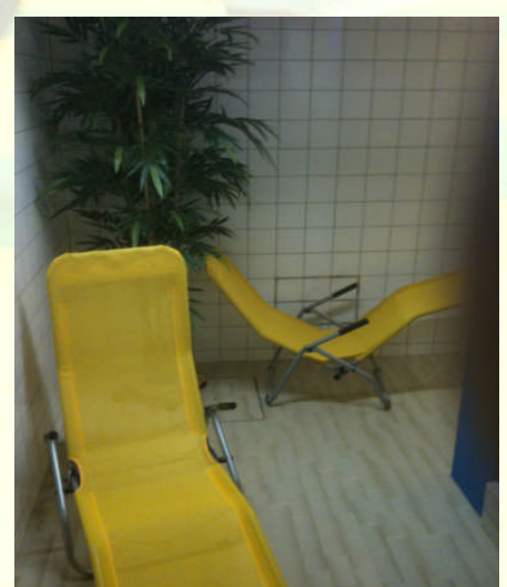
Entspannungsliegen im Saunaraum